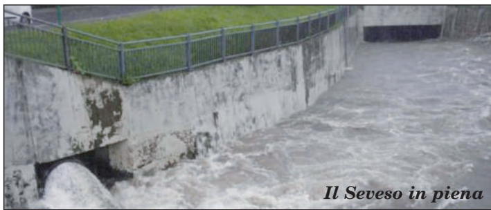
Il Seveso in piena

La vasca sarebbe costituita da un lago alimentato da acqua pulita di falda con un fondale a circa 10/12 metri dal piano di campagna, riempito di acqua durante la normalità per una profondità di circa 1,5 metri, e per il resto aperto con rive degradanti. Il fondo e le rive più ripide coperte normalmente dall'acqua saranno in cemento o simili e impermeabilizzate, mentre quelle normalmente a vista e più degradanti saranno a prato e qualche tratto in roccia. Lungo il perimetro vicino all'acqua ci sarà una ciclabile con parapetto in legno, mentre sulla riva superiore dove la parte degradante giunge al piano di campagna ci sarà una alberatura e una possibile seconda ciclabile. Il progetto prevede nelle zone circostanti la piantumazione di alberatura e una riqualificazione di alcune piccole aree lungo il corso del Seveso nel tratto vicino alla vasca. Nelle rive degradanti e in alcune isolette galleggianti saranno poste anche colture arboree fitopulenti, che permetteranno anche la nidificazione