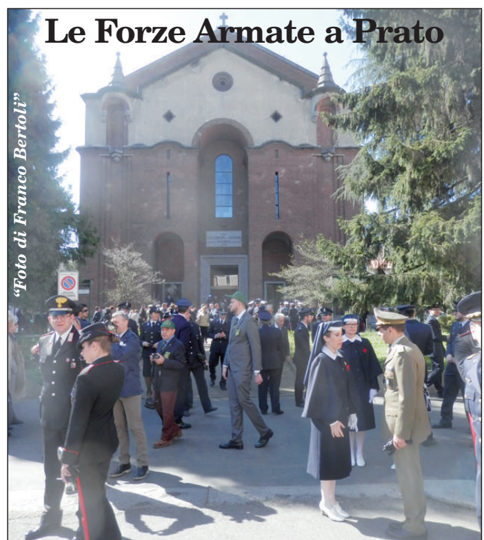
Martedì 31 marzo, presso la Parrocchia San Dionigi di Pratocentenario, l'annuale Cerimonia Pasquale delle Forze Armate milanesi.

"Aiuta con Dolcezza" è lo slogan che racconta la storia della Uildim (Unione italiana lotta alla distrofia muscolare). Uno slogan che riassume alla perfezione le attività che l'associazione riesce a portare avanti anche grazie ai fondi ottenuti dalla vendita di cioccolatini Lindt. Il chiosco della Uildim si trova all'interno dell'ospedale Niguarda, proprio di fronte al centro prelievi: presentando questo articolo, si potranno acquistare i prodotti Lindt con uno sconto aggiuntivo del 10% a quelli già praticati dal punto vendita. E il modo scelto dall'associazione per ringraziare tutti coloro che da anni la sostengono. La Uildim è attiva dal 1968 e svolge un'attività di informazione e sensibilizzazione sui problemi della disabilità derivanti dalle malattie neuromuscolari e assicura una serie di servizi socio-assistenziali e domiciliari grazie al contributo di numerosi volontari.