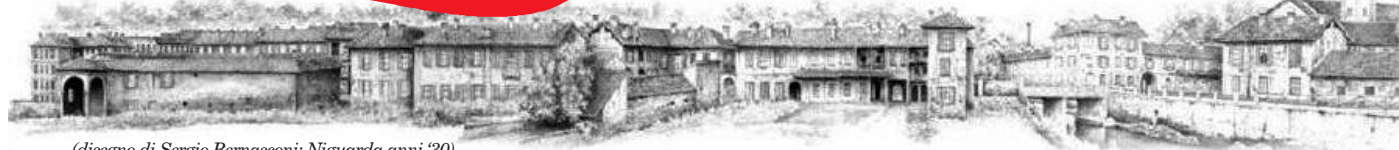
(disegno di Sergio Bernasconi: Niguarda anni '30)

"Zona Nove" è su www.niguarda.eu (archivio) e su www.zonanove.com (giornale online)