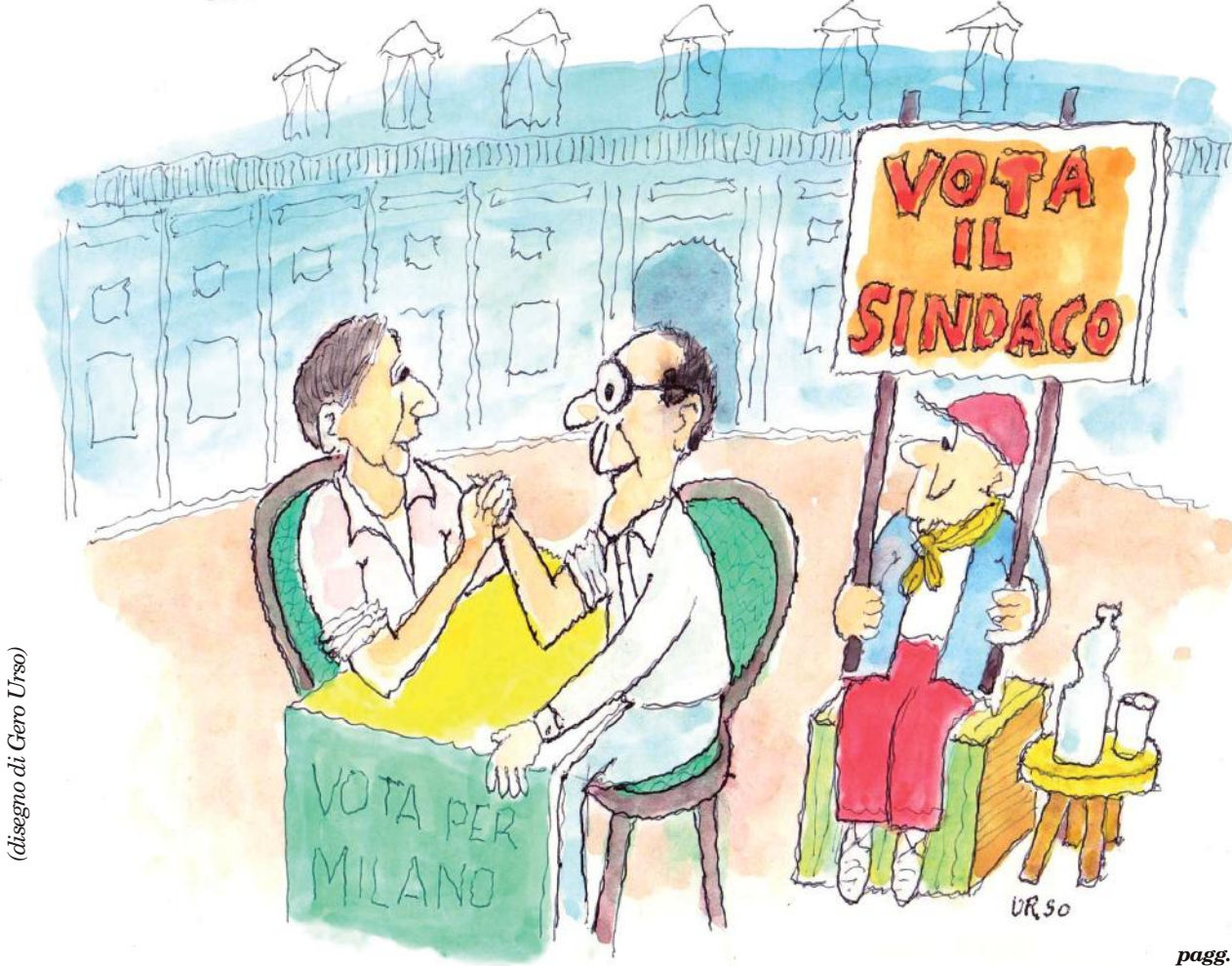
(disegno di Gero Urso)