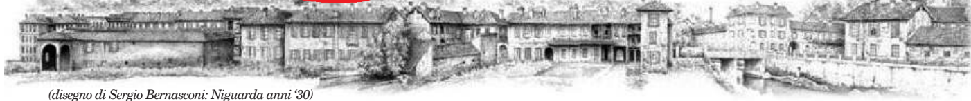
(disegno di Sergio Bernasconi: Niguarda anni '30)

GIORNALE DI NIGUARDA - CA' GRANDA - BICOCCA - PRATOCENTENARO - ISOLA Redazione: via Val Maira 4 (Mi), tel./fax 02/39662281, e-mail: zonanove@tin.it - Autorizzazione del Tribunale di Milano N. 64 del 8 febbraio 1997. Editore: Associazione Amici di "Zona Nove" - via Val Maira 4, Milano - Stampa: Litosud s.r.l. via A. Moro, 2, Pessano con Bornago (Mi).