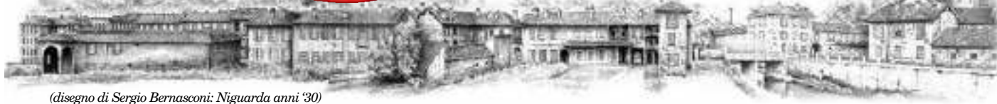
(disegno di Sergio Bernasconi: Niguarda anni '30)

GIORNALE DI NIGUARDA - CA' GRANDA - BICOCCA - PRATOCENTENARO - ISOLA Redazione: via Val Maira 4 (Mi), tel./fax 02/39662281, e-mail: zonanove@tin.it - Autorizzazione del Tribunale di Milano N. 64 del 8 febbraio 1997. Editore: Associazione Amici di "Zona Nove" - via Val Maira 4, Milano - Stampa: Litosud s.r.l. via A. Moro, 2, Pessano con Bornago (Mi).