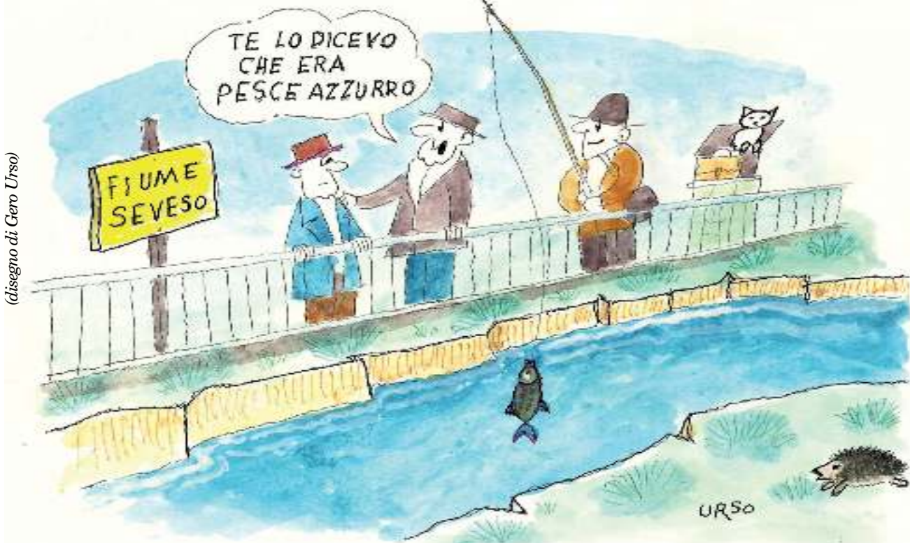
(disegno di Gero Urso)

Lo scorso 7 febbraio il Seveso è stato protagonista di uno spettacolare fenomeno cromatico. Dove scorre a cielo aperto, cioè tra Lentate a Cusano, si presentava di un intenso colore azzurro. In proposito si sono fatte le più varie supposizioni. I pescatori della vignetta di Gero Urso hanno per esempio sperato che si trattasse di un'invasione di pesci azzurri. Ma non era così. La causa, come al solito, era stata la rottura del tubo di scarico di una fabbrica di vernici. Menomale che l'impatto ambientale non è stato grave. Così, una volta tanto ci siamo goduti il Seveso come fosse la Scarioni e non come la solita fogna.